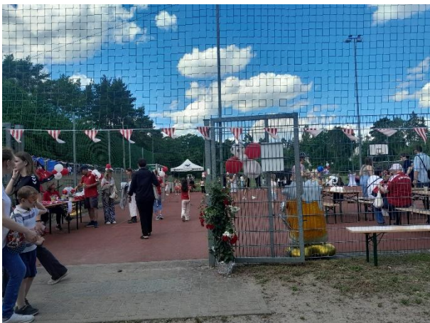
Tolles Wetter, viele Gäste beim Sommerfest der SG Rot-Weiß Groß Glienicke e.V. am 06.06.

See sportlich agieren? Gerade Sport verbindet über Grenzen hinweg. Das Sommerfest der SG Rot-Weiß Groß Glienicke e.V. am 06.06. war ein voller Erfolg, zeigte mit wie viel Spaß Groß und Klein dabei sind, wenn es um das Thema Sport geht. Die Sportfreunde Kladow e.V. laden herzlich zum diesjährigen Sommerfest am 20.06. ein. Der SportClub 2000 Groß Glienicke e.V. lädt zum Insel schwimmen am 05.07. und zum Zwei-Seen-Lauf am 30.08. ein. Der Motorsportclub Groß Glienicke e.V. richtet die Motocross Landesmeisterschaften am 04.+05.07. aus. Verfolgen Sie alle sportlichen Informationen zum Beispiel hier https://gross-glienicke.potsdam.de/veranstaltung/sport-sommerfest-der-sportfreunde-kladow oder direkt auf den Web-Seiten der Sportvereine rings um den Groß Glienicke See.