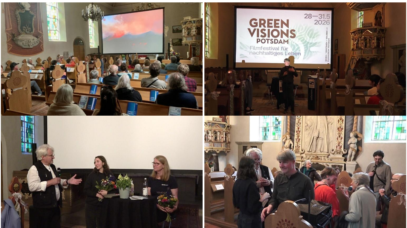
Am 30.05. verwandelte sich unsere Dorfkirche in ein "Kiezkino" des Filmfestivals Green Visions